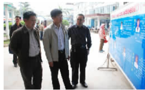
扶绥县县委副书记、县长罗彪莅临空港院区视察工作。