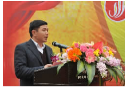
扶绥县委书记蓝大煌致辞。