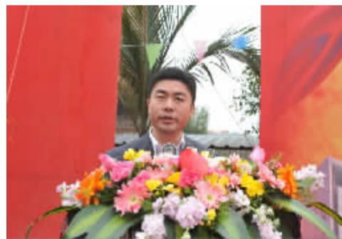
崇左市委常委、常务副市长白松涛致辞。