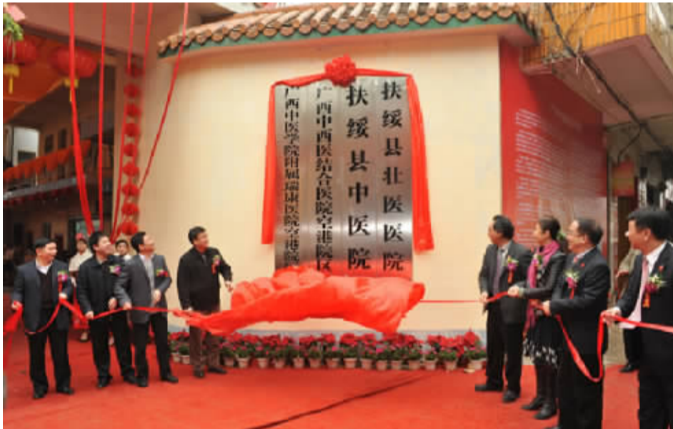
领导和嘉宾为空港院区揭牌。